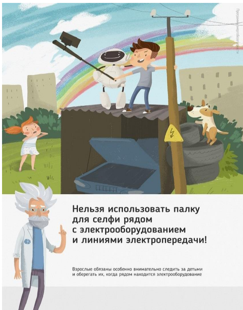
Рис 2. Нельзя использовать палку для селфи рядом с электрооборудованием и линиями электропередачи

Ну и, наконец, нужно повторить с ребенком алгоритм действий в экстремальной ситуации. Проверьте, умеет ли он набирать на сотовом телефоне телефон экстренных служб. Изучите с ним вещества и предметы, которые хорошо проводят электрический ток и потому особенно опасны, и, наоборот, вещества и предметы, плохо проводящие электрический ток и полезные в экстремальной ситуации.