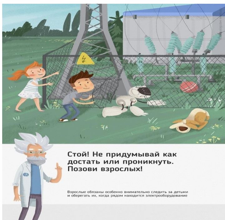
Рис. 5 Стой! Не придумывай как достать или проникнуть. Позови взрослых!