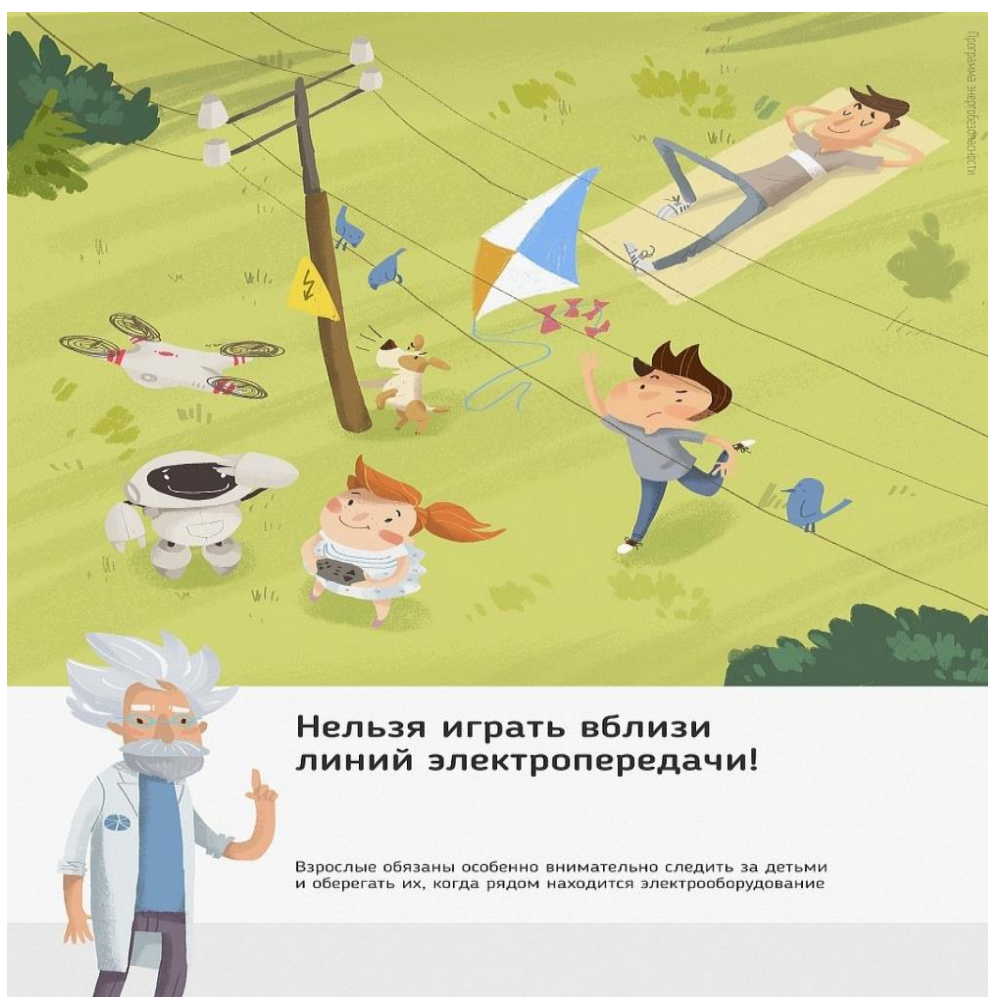
Рис.3 Нельзя играть вблизи линий электропередачи