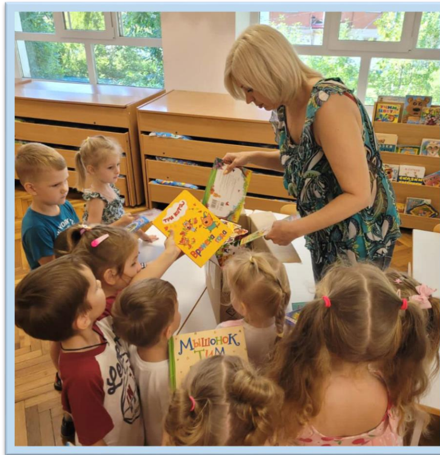
«Дети - детям» #МЫВМЕСТЕ