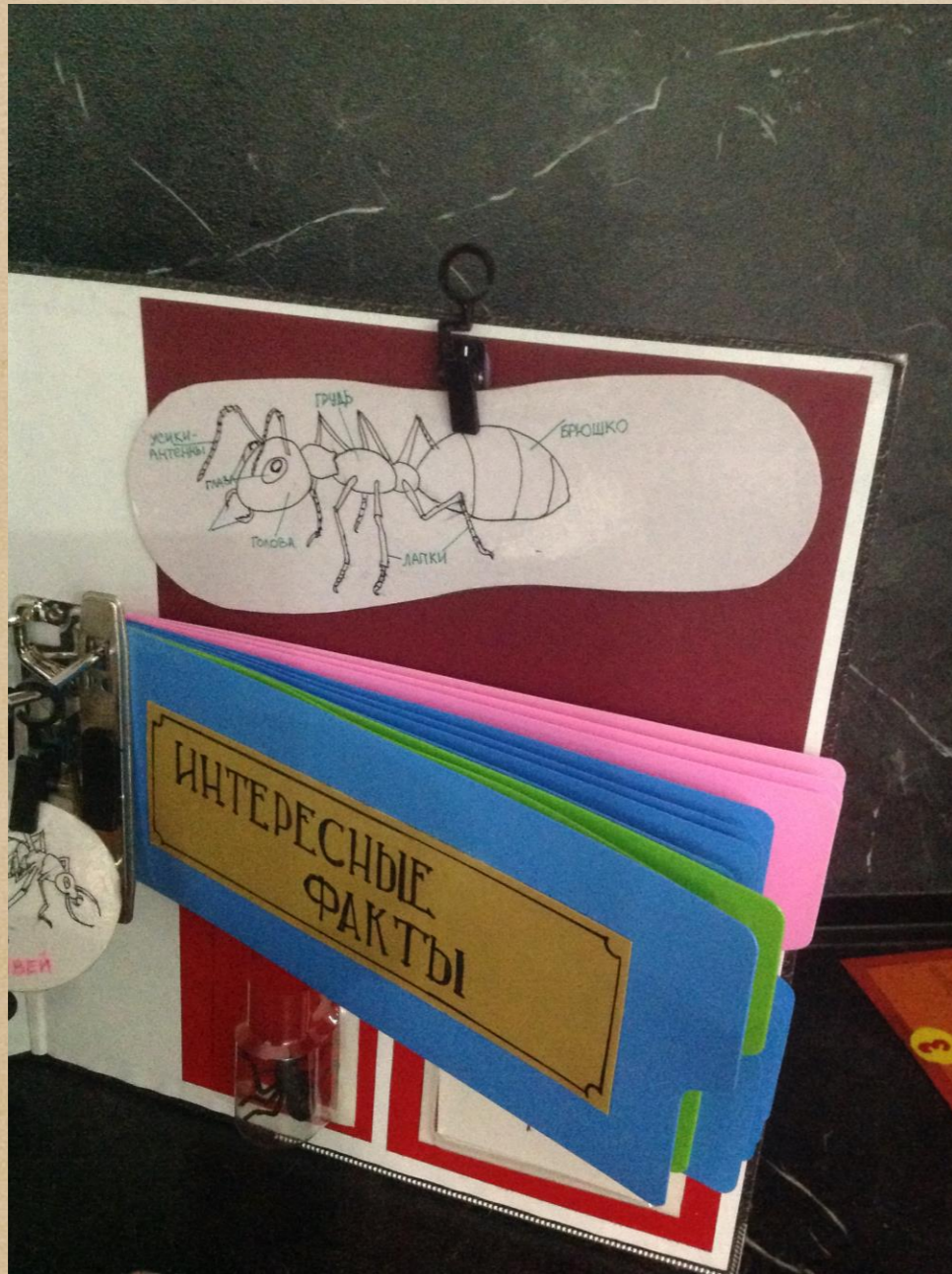
Схема-рисунок «Части тела муравья»